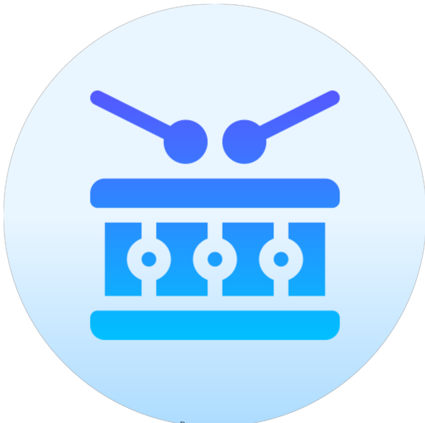
Ритмическая мозаика (3-5 лет)